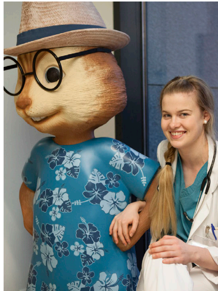
Sífeltil fleiri börn koma með bangsann sinn til aðhlyningar á barnaspítala Hringins. MYNDIERNIR