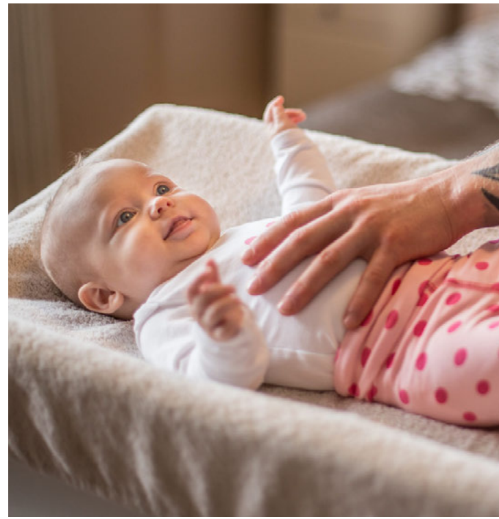
Langflest slys verða inni á eða við heimilið enda er mestum tíma barnanna varið þar.