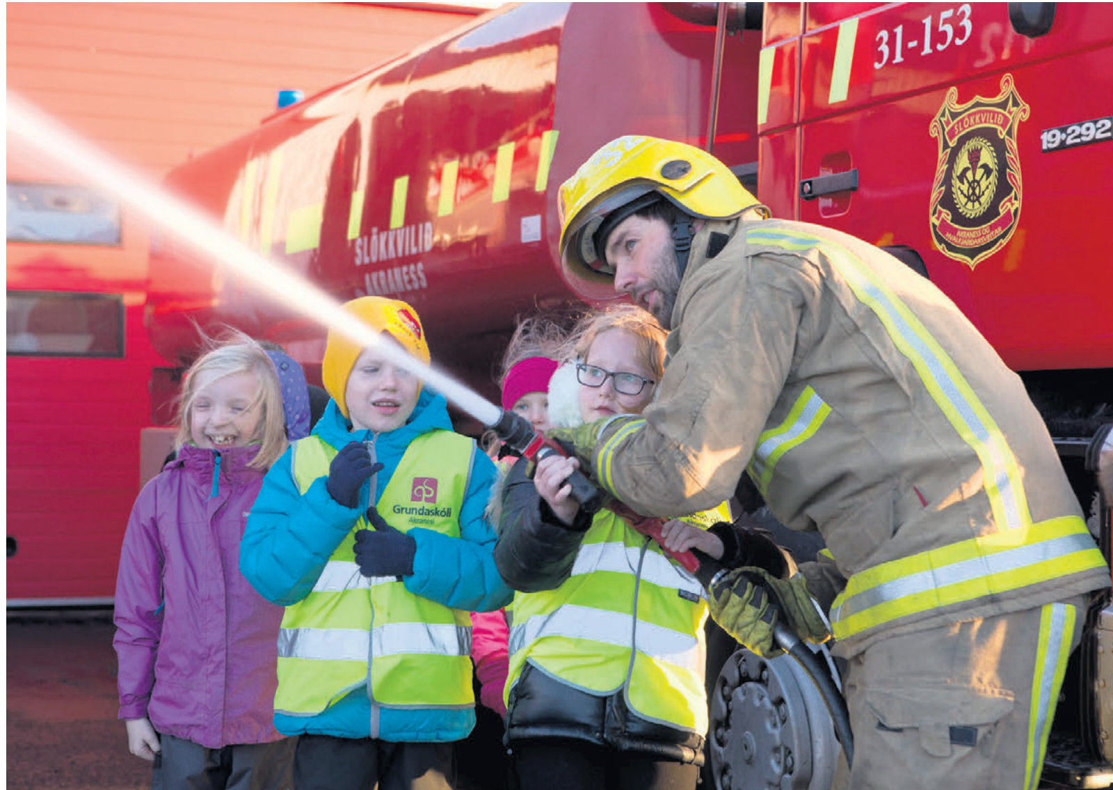
Slökkviliðsmenn fræða börn í 3. bekk grunnskólanna ár hvert um eldvarnirnar heima fyrir og leyfa þeim svo gjarnan að skoða og prófa búnað slökkviliðsins. Myndin var tekin þegar börn úr Grundaskóla, Brekkubæjarskóla og Heiðarskóla heimsóttu Slökkvilið Akraness og Hvalfjarðarsveitar í haust. SÍÐA 2