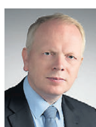
Illugi Gunnarsson mennta- og menningarmálaráðherra

Í dag verður 112-dagurinn haldinn víða um land líkt og undanfarin ár með það að markmiði að kynna neyðarnúmerið einn-einn-tveir og mikilvægi þess.