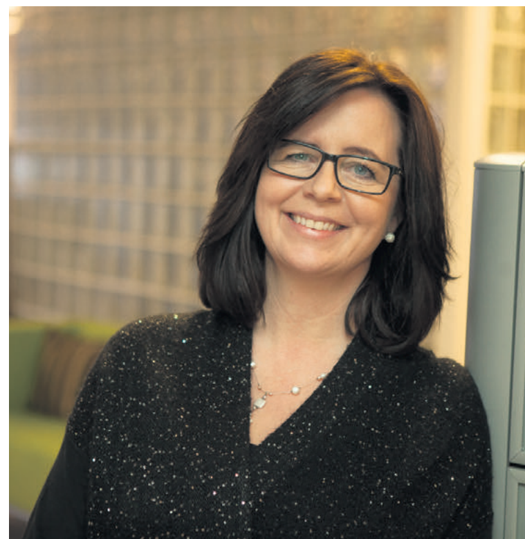
Fræðslan snýst um það að börn þekki helstu slysaáættingar á skólalóðinni og í nánasta umhverfi.

„Fræðslan snýst um það að börn þekki helstu slysaáættingar á skólalóðinni og í nánasta umhverfi, að þau viti hver eru fyrstu viðbrögð við slysum, læri að nota leiktæki rétt og læri að nota hiltæki rétt. Eins að þau varist öryggisþúða í framsætum. Krakkarnir eru mjög áhugasamir í þessari fræðslu og þau eru