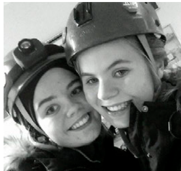
Auk reglulegra funda fer hópurinn í ýmsar skemmtilegar ferðir, tjaldútilegur og á landsmót fyrir unglingsdeildir.

Auk reglulegra funda fer hópurinn í ýmsar skemmtilegar ferðir, tjaldútilegur og á landsmót fyrir unglingsdeildir. „Bráðum verður til dæmis slöngubátanámsskið þar sem við megum taka þátt og síðan fáum við að mæta á fyrstu fundina með Þorbirni síðar á árinu. Við förum bæði í dags- og helgarferðir og heimsækjum viðbragðsaðila, svo sem lögreglu, slökkvilið eða Neyðarlínuna. Svo heimsækjum við líka aðrar unglingsdeildir þar sem