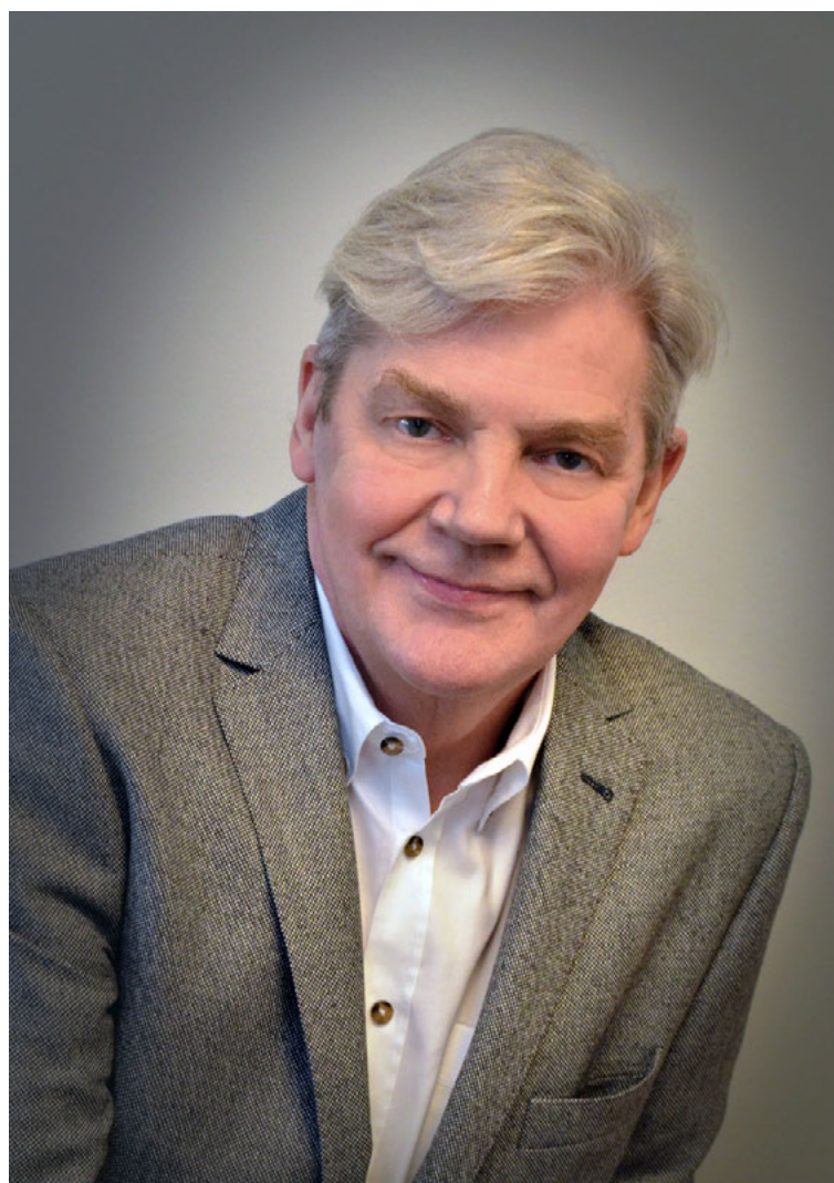
Fimm til sex prósent af heildarfjölda barnaverndartilkynninga hafa að jafnaði komið í gegnum 112 á ári hverju frá því samstarf 112 og barnaverndarnefnda hófst fyrir rúmum tíu árum.

112 hóf að taka við barnaverndartilkynningum í ársbyrjun 2004, eða fyrir rétt rúmum tíu árum. Tilgangurinn var að greiða fyrir því að almenningur gæti fullnægt tilkynningaskyldu sinni og að gera fólki auðveldara að koma á framfæri ábendingum og upplýsingum – tafarlaust. Samstarf 112 og barnaverndarnefnda hefur reynst afar vel og er fyrirmynd annarra þjóða í Evrópu.