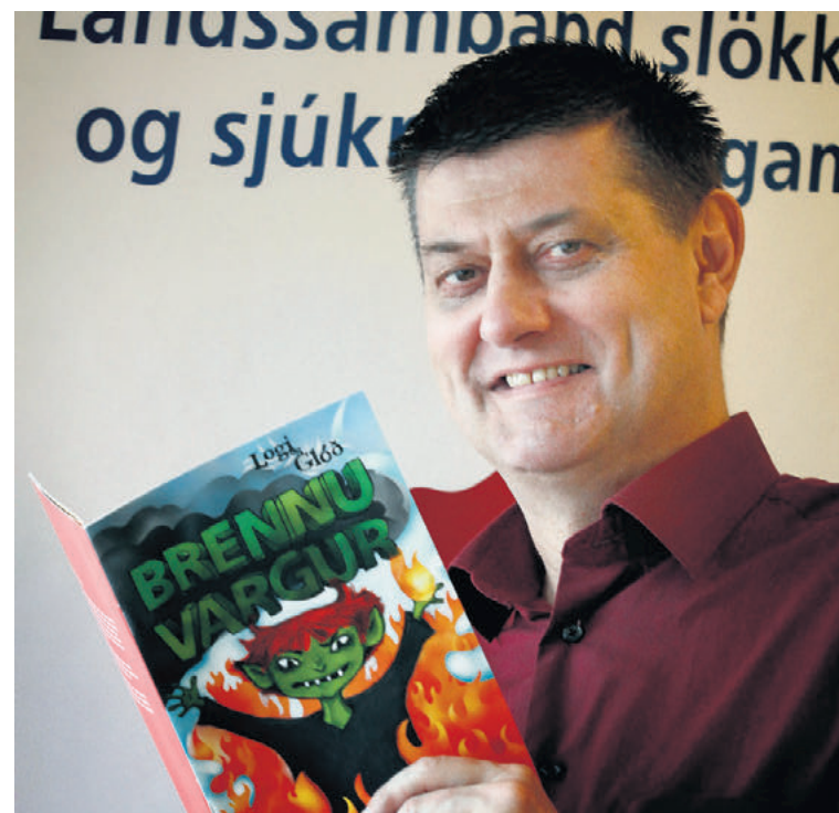
Reynslan sýnir okkur að eldvarnafræðsla til barna skilar sér inn á heimili þeirra.

Átakið byrjaði fyrir 22 árum, þannig að rúmlega hundrað þúsund manns á aldrinum níu til 32 ára hafa fengið þessa fræðslu hjá LSS. „Í skólaheimsóknunum kennum við jafnframt kennurum að