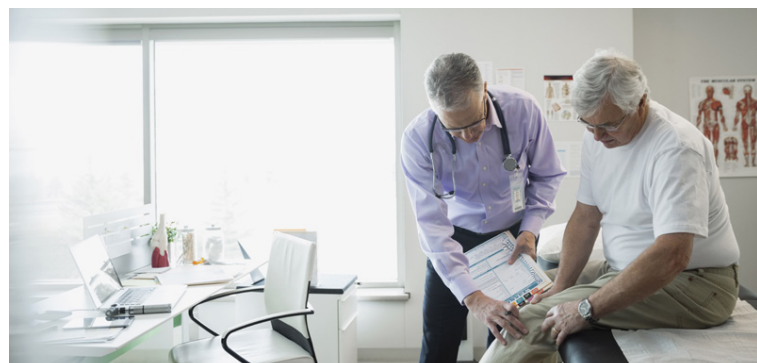
Slys sem aldraðir verða fyrir eiga sér aðallega stað á heimilum eða í kring um heimilin. Það er í samræmi við erlendar rannsóknir.