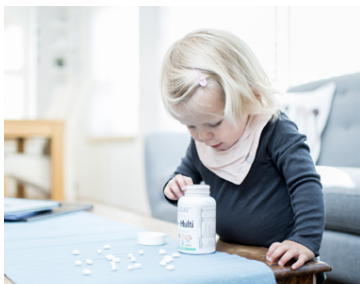
Passa þarf vel lyf á heimilinu.

Eitrunarmiðstöðin rekur símaþjónustu allan sólarhringinn fyrir