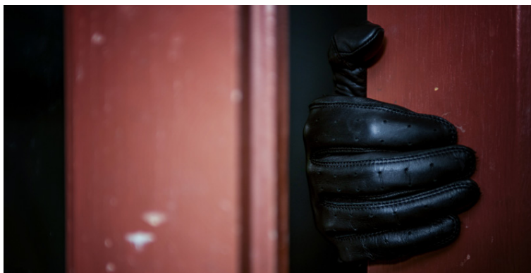
Skipulögð brotastarfsemi færast í aukana á höfuðborgarsvæðinu.

lykilatriði að viðbragðsaðilar komist sem allra fyrst á staðinn til að veita aðstoð segir hann. „Til að auðvelda slíkt er algjört lykilatriði að hús séu vel merkt með húsnúmeri á áberandi stað sem sést vel frá götu. Þá er nauðsynlegt að dyrabjöllur séu vel merktar sömu leiðis, hvort heldur er í fjölbýlishúsum eða annars staðar.“